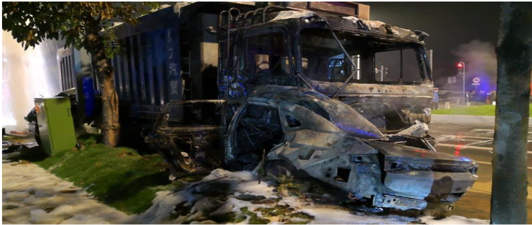
图 6 粤 AD14689 号小型轿车事故后情况

2. 赣 C3B058 号重型平板自卸货车，登记所有人：江西江龙集团浩宸汽运有限公司，地址：江西省宜春市高安市上湖乡，检验有效期至 2020 年 07 月 31 日，保险公司：中国人民财产保险股份有限公司，强制保险单号：PDZA2019362200****8808，商业保险单号：PDAA2019362200****0546，有效期均至 2020 年 07 月 26 日 24 时。经“全国被盗抢信息系统”查询，赣 C3B058 号重型平板自卸货车没有被盗抢记录。