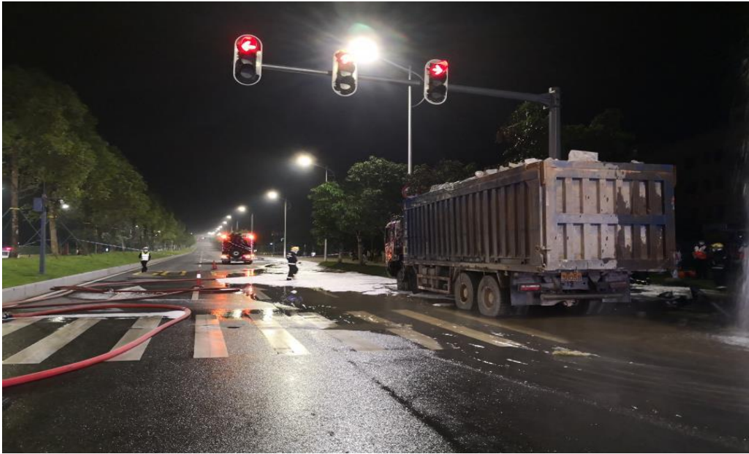
图7 赣 C3B058 号重型平板自卸货车事故后情况