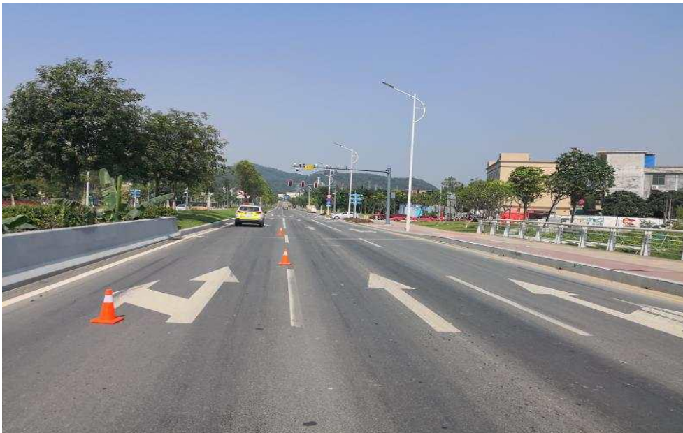
图 3 事发路段地面标线情况

事故现场位于广州市黄埔区兴龙大道出柯岭路东 23 米处，出事路段呈东西走向，双向六车道，以中心绿化带分隔，有交通信号灯，地面标线清晰，夜间有路灯照明，限速 60km/h，现场路口有监控。