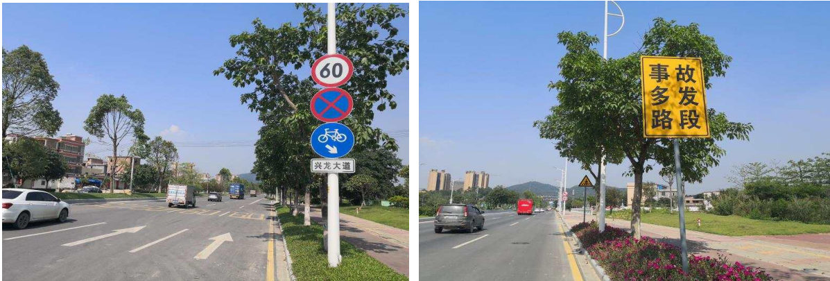
图 4、5 事发路段限速警示情况